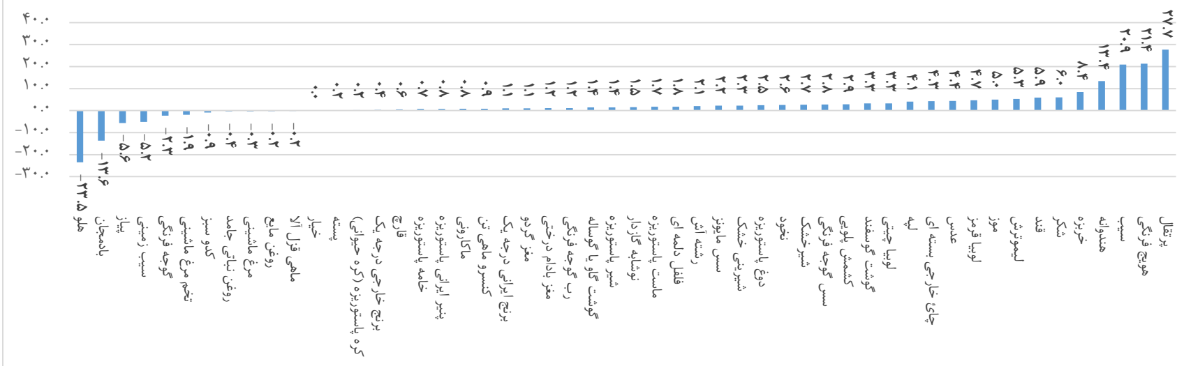
نمودار ۱: درصد تغییر متوسط قیمت ماه جاری نسبت به ماه قبل (تیر ۱۴۰۳)

دقیق‌ترین تعریف برای مفهوم «متوسط» یعنی «متوسط قیمت پرداخت شده برای محصولی با کیفیت ثابت». این مفهوم به محصولی کاملاً مشخص (محصولی با مشخصات دقیق و ثابت طی زمان) با ترکیبی از وزن یا مقدار مشخص نیاز دارد. این هدف تنها با داده‌های اسکنری قابل دسترسی است. در این گزارش از قیمت‌هایی که برای محاسبه شاخص قیمت مصرف‌کننده جمع‌آوری می‌شوند، استفاده شده است. این قیمت‌ها طیف وسیعی از یک محصول با کیفیت‌های متفاوت را شامل می‌شود.